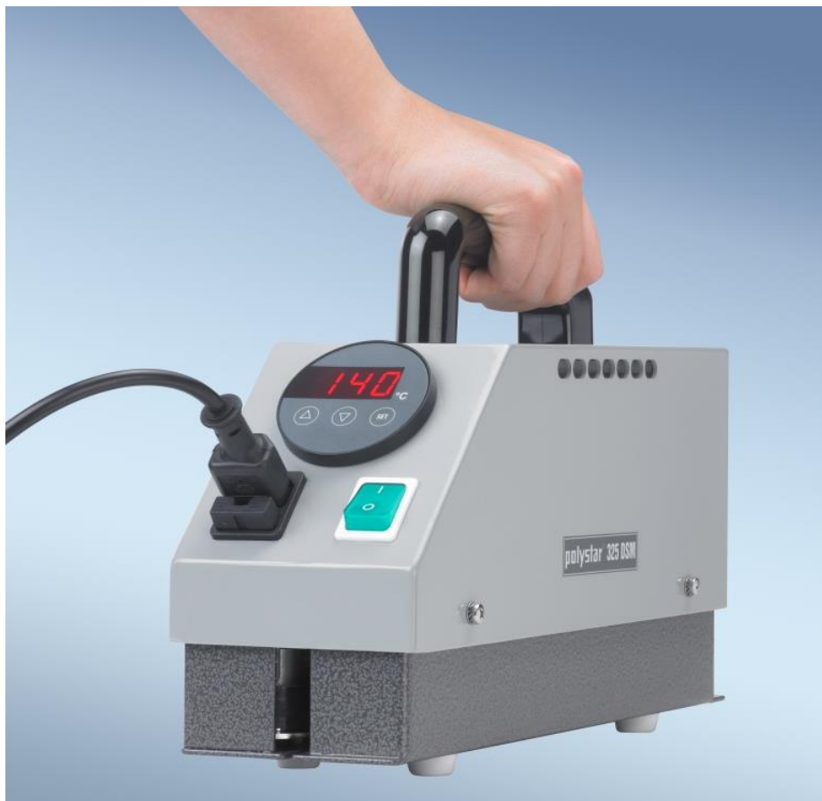
polystar® 325 DSM

有了这个轻型和手动引导的连续式封口机，您可以很容易和快速密封所有大尺寸的塑料袋和聚乙烯薄膜袋子。